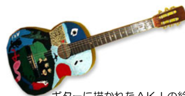
ギターに描かれたAKIの絵